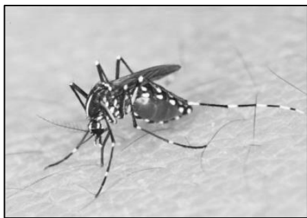
ヒトスジシマカ

2014年は代々木公園を中心とした「デング熱」の流行、2016年はリオオリンピック開催国ブラジルでの「ジカ熱」の流行と、蚊が媒介する感染症が話題となっています。日本では蚊に刺されて病気