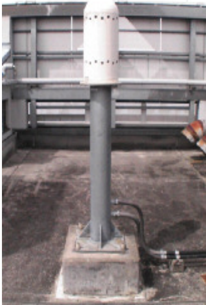
写真 (モニタリングポスト測定部)

放射線量は、当センター屋上に設置されているモニタリングポスト（写真、参照）という機器を使って、毎時間測定しています。モニタリングポストに放射線が当たると、放射線のエネルギーが電気信号に変わり、その電気信号の数を計数することにより測定を行っています。この場合、「シーベルト」や「グレイ」という単位を主に用いて、放射線量を表しています。