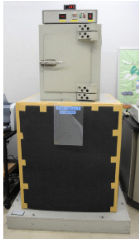
写真 (ゲルマニウム半導体検出器)