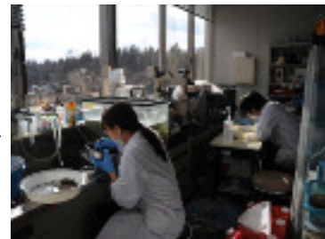
(計画停電のため窓際で作業する研究員)