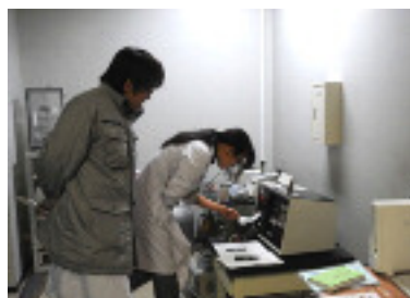
(環境放射線の測定)

そのほか、各部の業務においても、停電など地震の影響に対応するため、様々な工夫がなされました。