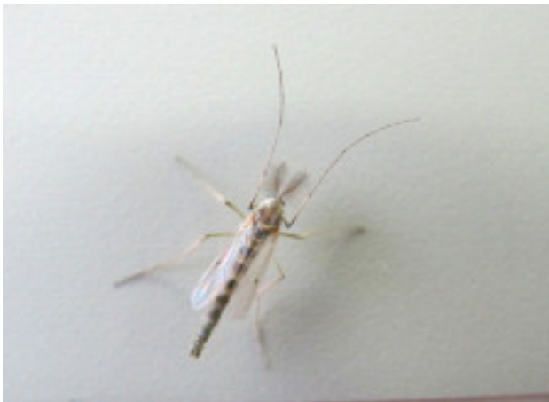
写真1 ユスリカの成虫(雄)

突然ですが“ユスリカ”という生き物をご存じでしょうか。夕暮れに水辺を散歩していると、ちょうど人の頭の高さあたりで、群れをなして飛び回っている小さな生き物がユスリカです。