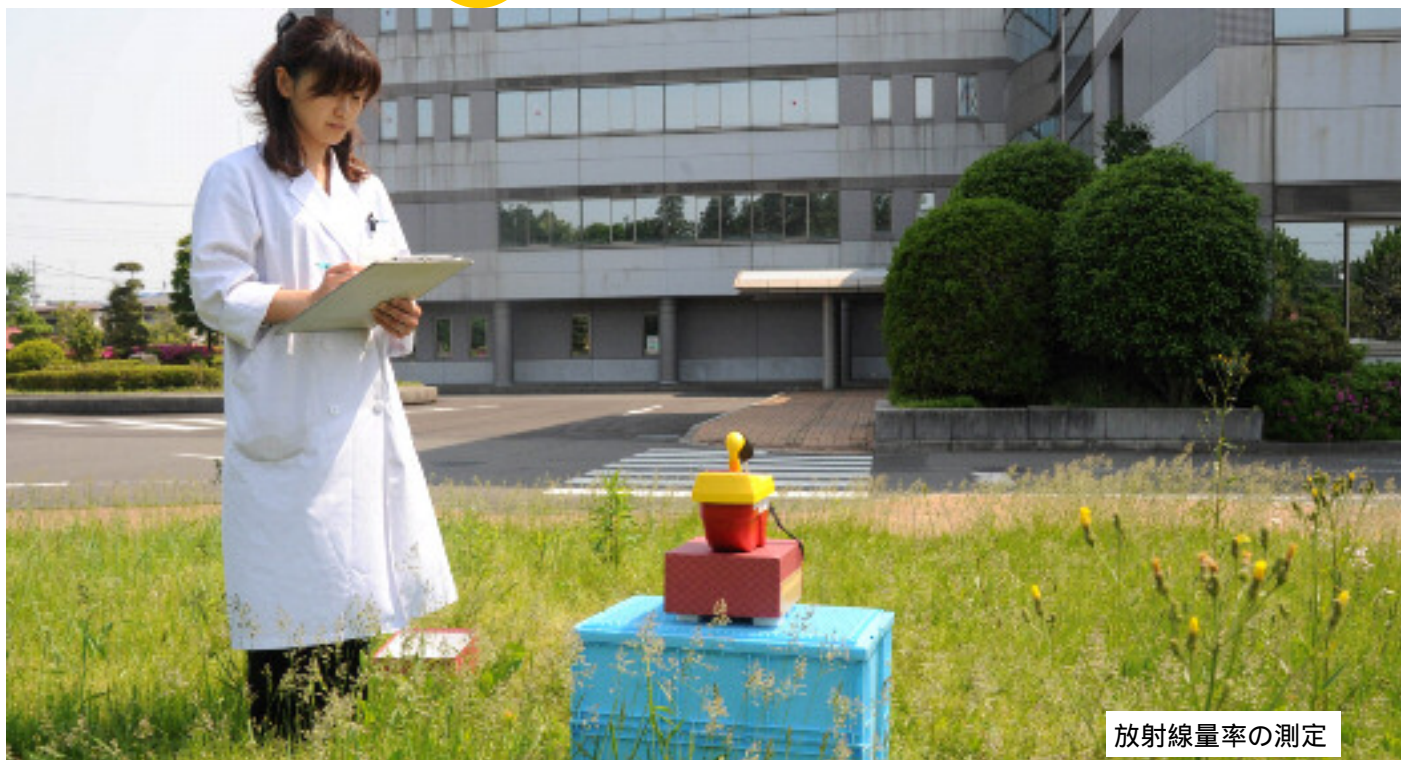
放射線量率の測定