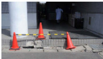
(破損した外構部分)

建物の外周や館内複数箇所の壁や床に亀裂や段差の発生があり、漏水により一時断水となりました。また、一部の測定機器に、修理・点検が必要となり、ガラス製の機器も多数破損しました。ただ、薬ビンなど中身が漏出すると影響