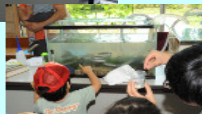
(H22年度の開催の様子)