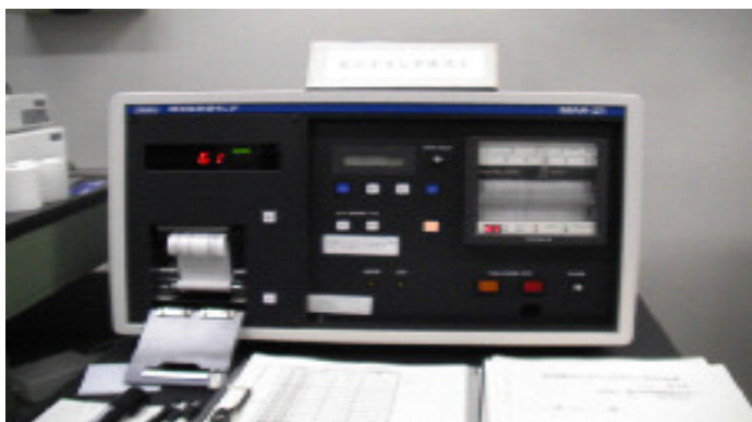
写真 (モニタリングポスト表示部)

放射能は、主に水道水や雨などを、ゲルマニウム半導体検出器（写真参照）という機器を使って毎日測定しています。